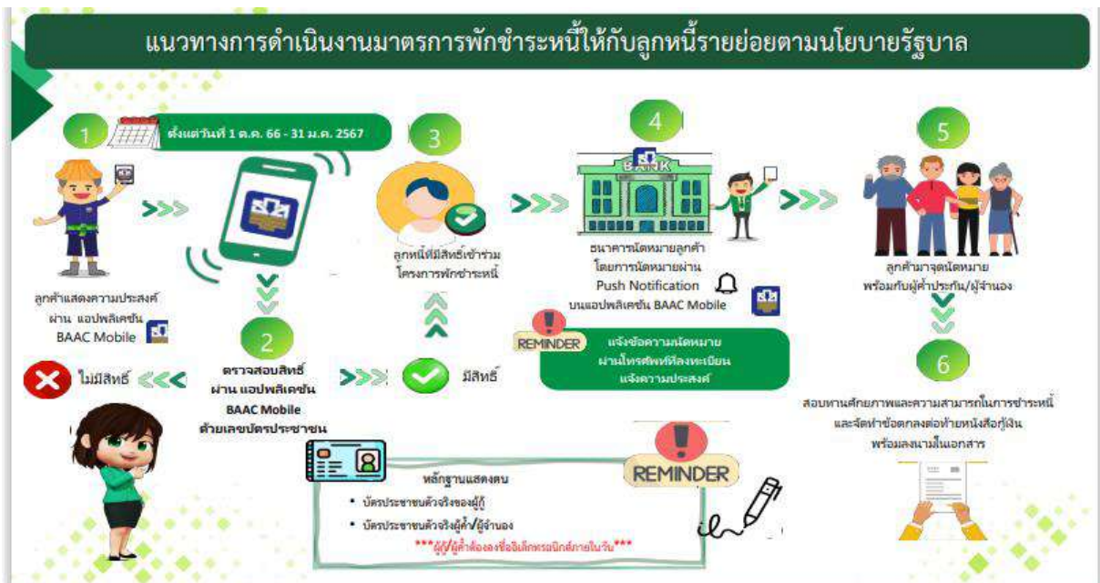
แผนภาพที่ ๑ แนวทางการดำเนินงานมาตรการพักชำระหนี้ให้กับลูกหนี้รายย่อยตามนโยบายรัฐบาล

๕) ธ.ก.ส. ทำการสอบทานศักยภาพและความสามารถในการชำระหนี้ และจัดทำข้อตกลง ต่อท้ายหนังสือกู้เงิน พร้อมลงนามในเอกสารอิเล็กทรอนิกส์